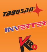
Wybrane modele piecyków elektrycznych