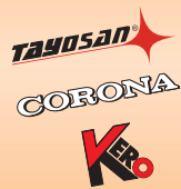
Wybrane modele piecyków tradycyjnych

UNI-LUX oferuje na rynku polskim od roku 1999 szeroką gamę piecyków tradycyjnych i elektrycznych produkowanych przez dwie japońskie firmy : CORONA CORPORATION- największego producenta piecyków naftowych na świecie (marki Corona oraz Inverter) oraz SENGOKU WORKS LTD (marki Tayosan oraz Kero).